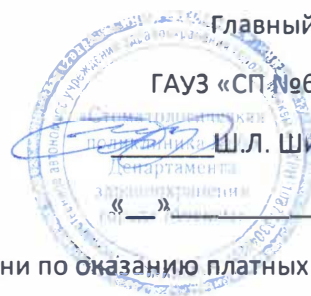
График работы врачей, мед. сестёр в выходные и праздничные дни по оказанию платных медицинских услуг