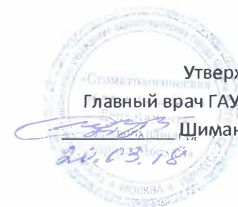
График работы платных медицинских услуг 1 отделения терапевтической стоматологии за апрель 2018 года.